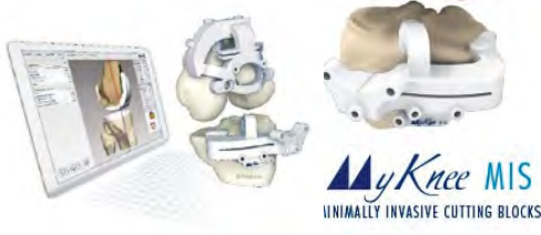
3D Knee MIS MINIMALLY INVASIVE CUTTING BLOCKS

(※変形の状態によっては、このシステムが使用できない場合がありますので、詳しくは京医師にご相談ください)