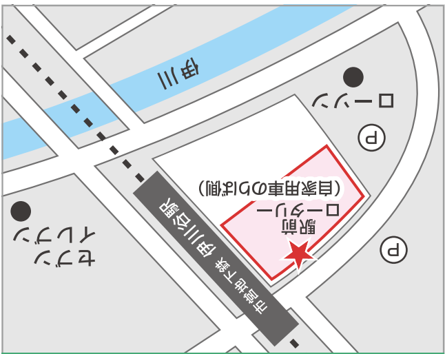
伊川谷駅「駅前ロータリー」