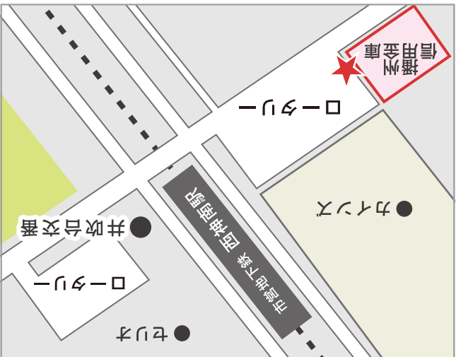
西神南駅「ロータリー・播信」前