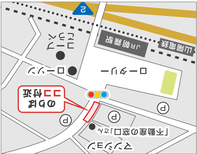
JR朝霧駅「山側交差点」付近